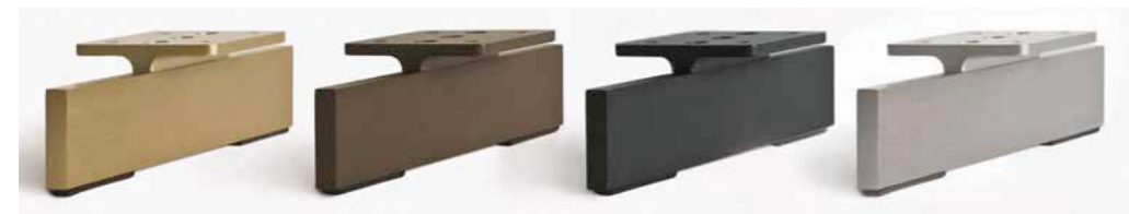
Verniciato oro satinato Satin gold painting